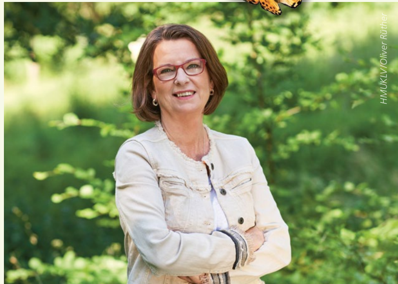
Hessens Umweltministerin Priska Hinz

Priska Hinz: Das Ziel der hessischen Umweltlotterie ist es, flächendeckend viele lokale Umwelt- und Naturschutzprojekte zu unterstützen. Vereine, Schulen, Kitas oder ehrenamtliche Naturschützerinnen und Naturschützer können ganz einfach mitmachen und ihre Projektvorschläge einreichen. Ob der Schutz von bedrohten Arten, die Sanierung eines Teichs oder die Pflege eines Schulgartens, alles ist möglich. Das eingereichte Projekt sollte aber einen klar erkennbaren Bezug zur Umwelt haben und natürlich in Hessen liegen. Alles wei-