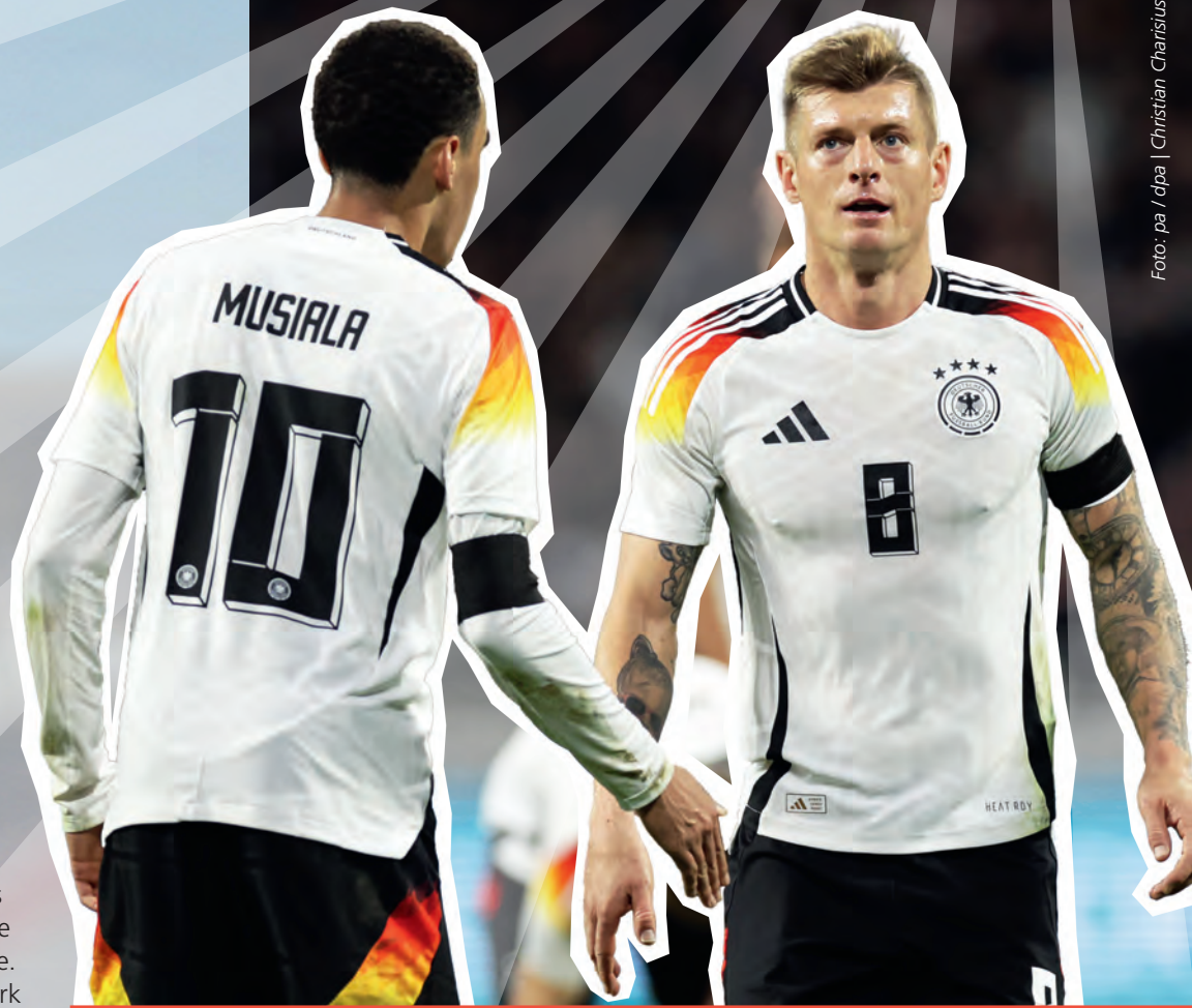
Toni Kroos (re.) kehrte für die Heim-EM in die Nationalelf zurück. Gemeinsam mit Shootingstar Jamal Musiala (li.) will er den Titel holen.

Außenseiter in die Siegerliste ein. 1976 triumphierte die Tschechoslowakei gegen die deutsche Elf um Franz Beckenbauer und Sepp Maier im Elfmeterschießen. Auch bei der nächsten Sensation 1992 hatte Deutschland das Nachsehen. Wegen des Krieges in ihrer Heimat blieben die qualifizierten Jugoslawen zu Hause. Dafür sprang kurzfristig Dänemark ein. Die direkt aus dem Urlaub ange-reisten Spieler zündeten in Schweden das „Danish Dynamite“, schafften es ins Endspiel und besiegten die Deutschen 2:0.